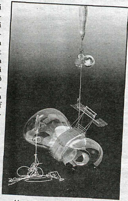
Uppblásið garðhús eftir Richard Rogers. Frægasta bygging hans er líklega Pompidou safnið í París sem hann gerði ásamt Renzo Piano.