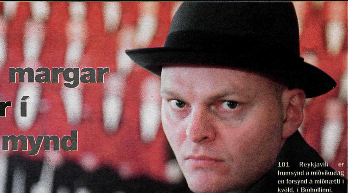
101 Reykjavík er frumsýnd á miðvikudag en forsýnd á miðnætti í kvöld, í Bióhöllinni.