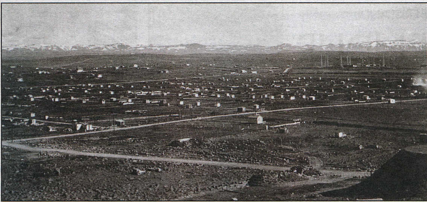
Alvöru garðhúsabær: Kartöflukofarnir í Kringlumýri um 1950. Horft er yfir kartöfluræktarlönd Reykvíkinga, en neðst til hægri er vatnsgeymirinn.