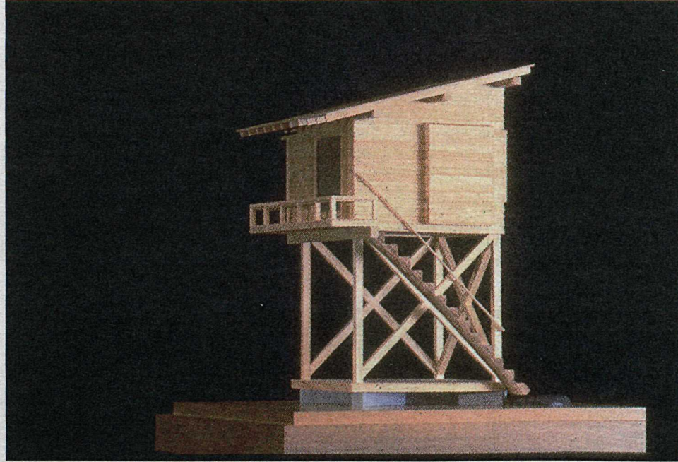
Arata Isosaki, Japan.

Þó svo garðhúsabæir eigi sér sterkastar rætur í Danmörku má finna hliðstæðu þeirra í flestum löndum. Sú er og raunin hér á landi, enda þótt vöxtur þéttbýlis í kjölfar iðnvæðingar hafi komið síðar til. Um og eftir 1933 var úthlutað ræktunarlöndum (erfðafestulöndum) í Kringlumýri og nærliggjandi svæðum í bæjarlandi Reykjavíkur. Hugmyndin með ræktunarlöndunum var m.a. sú að veita atvinnulausu