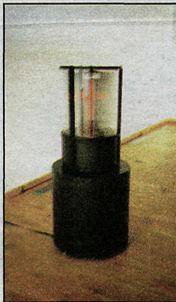
Elektrónískt skilti úr myndröðinni Lustmord, frá 1993 - 94, eftir Jenny Holzer.

Fánar eða Tvö málverk frá 1973 - 1978, eftir Daniel Buren eru dæmigerð fyrir listamanninn.