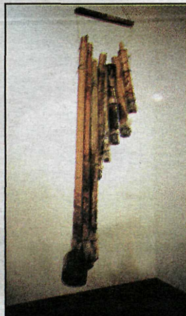
Lyktarorgel Dieter Roth er komið í sitt upprunalega form.

benda á hið yfirgripsmikla verk Tehcing Hsieh, One Year Outdoor Piece – Eins árs utandyraveik – frá 1981 til 1982, á miðgangi Kjarvalsstaða. Listamaðurinn lagði á sig að lifa sem utangarðsmaður í heilt ár án þess að koma heim til sín, og lýsa afstöðukort á veggnum staðsetningu Hsieh í New York alla þá tólf mánuði sem hann dvaldi fjarri íbúð sinni. Þá sýna gagnsær kassar fatnaðinn sem hann íklæddist sem utangarðsmaður.