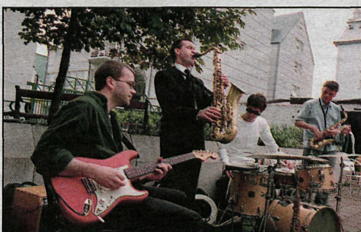
Djassað á menningarnótt