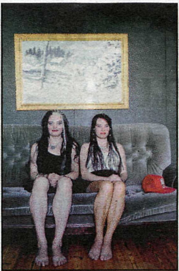
„Þær voru að fara út að dansa þegar ég kom.“ Mynd frá Viitasaari í Finnlandi.