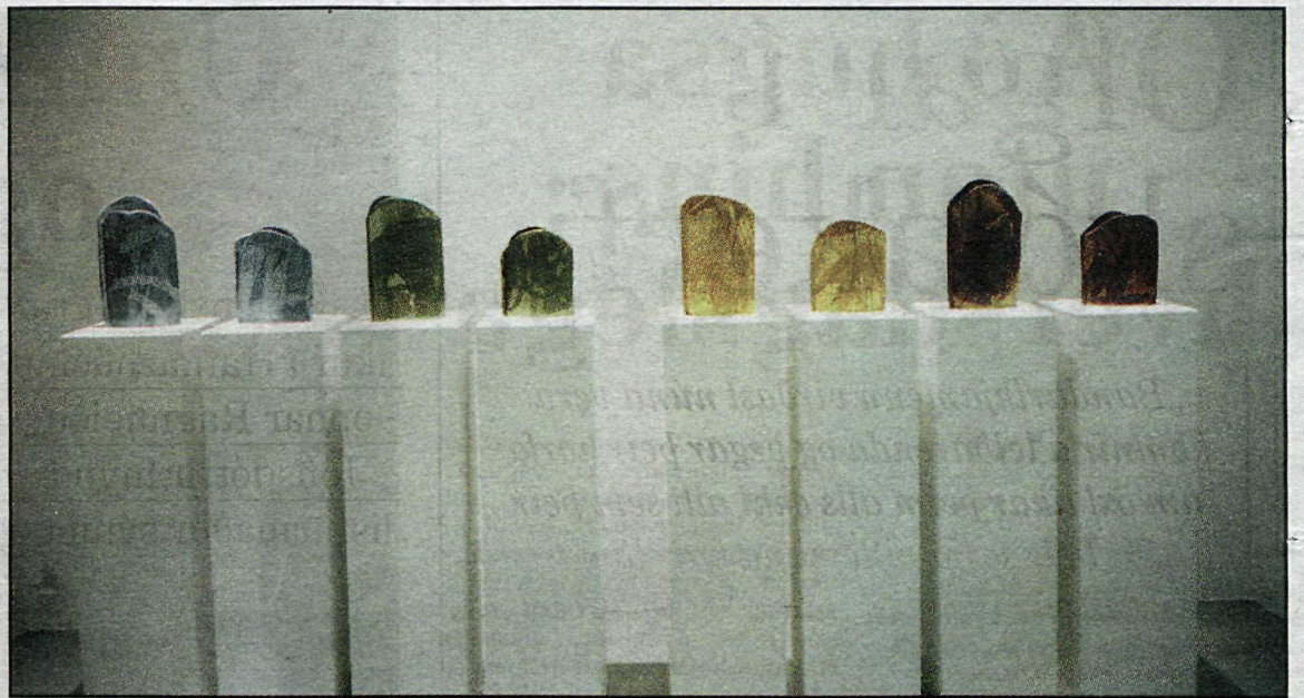
Ein af myndunum á sýningunni í Gallerí Man.