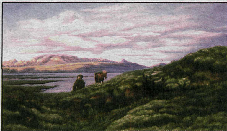
Þórarinn B. Þorláksson: Áning.

Á næstu vikum gefst okkur tækifæri til að meta hann á ný á viðamikilli yfirlitssýningu sem verður opnuð í Listasafni Íslands á laugardaginn. Listasafnið á gott úrval verka eftir Þórarin, 34 verk, en meðal þeirra er fyrsta íslenska málverkið sem safnið eignaðist, „Áning“, sem listamaðurinn gaf því árið 1911. Auk þeirra hefur verið safnað fjölda verka hans og mun alls gefa að líta 160 myndir listamannsins á þessari sýningu.