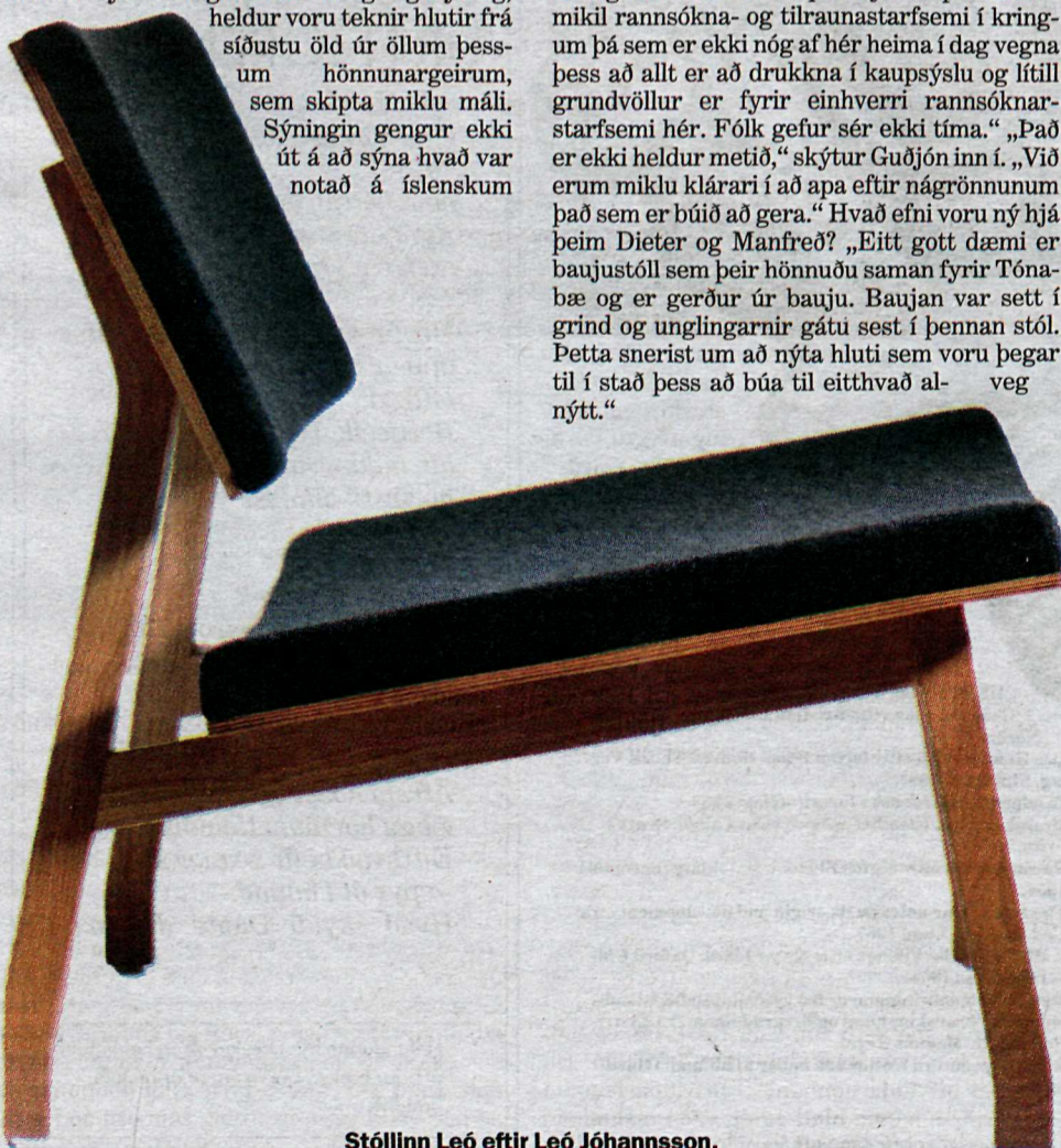
Stóllinn Leó eftir Leó Jóhannsson.

Guðjón lauk námi í arkitektúr í London og vann síðan í rannsóknahóp sem rannsakaði þessa aðferðarfræði í skipulagi en hvers vegna var Reykjavík valin sem rannsóknaverkefni? „Ástæðan fyrir því að við tókum Reykjavík sem rannsóknardæmi er sú að borgin er eitt af því versta skipulagi sem þekkest í heiminum.