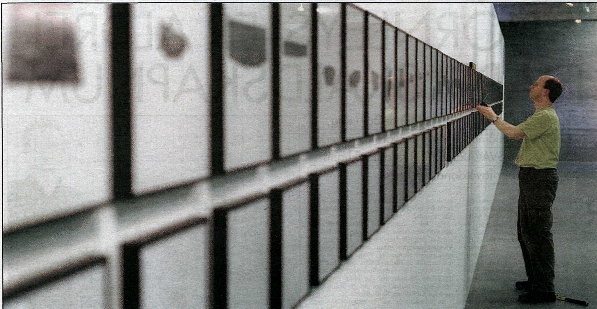
Lokahönd lögó á frágang sýningarinnar í Hafnarhúsinu.