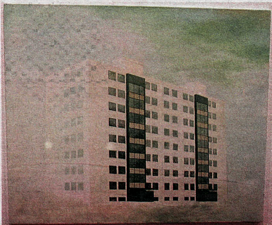
Kleppsvegur Sigríður Ólafsdóttir.