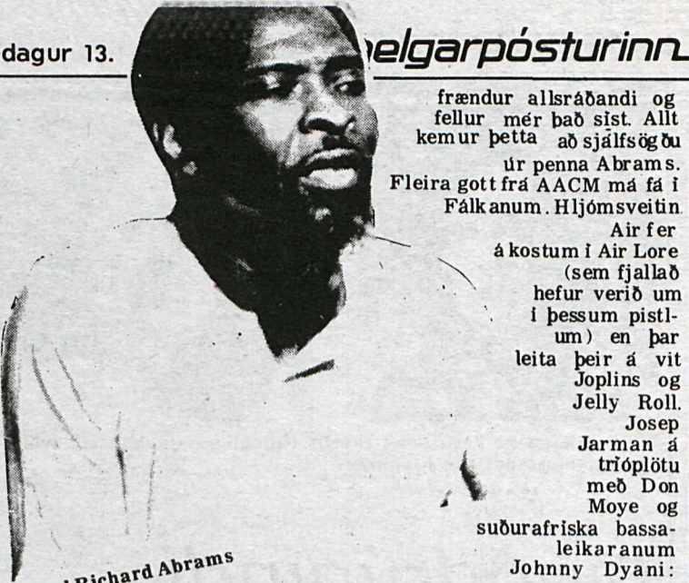
Muhal Richard Abrams

Braxton hefur samið mikið í evrópskum stíl og það hefur fyrsti forseti AACM, Muhal Richard Abrams, líka gert. Skifa hans Spihumonesty (Black Saint 0032) er samin í þessum frjála svartevrópska stíl, sem hæst hefur náð hjá þeim Abram & Braxton og Cecil Taylor & Cörlu Bley.