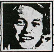
Myndlist eftir Halldór Björn Runólfsson

Sýning Arnar Inga sannar ótvírætt, að sérstæð og athyglisverð list dafnar nú fyrir norðan og mættu Reykvikingar líta ögn upp úr eigin naflaskoðun, til að mættaka strauða annars staðar frá.