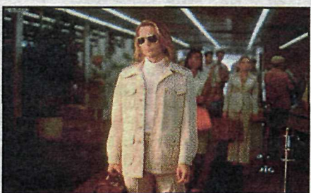
Blow Johnny Depp í hlutverki kókaínsmyglarans George Jung.

Nýjar kvikmyndir setja svip sinn á listann yfir vinsælustu kvikmyndirnar í Bandaríkjunum um helgina, án þess þó að velta fjölskyldumyndinni Spy Kids úr efsta sætinu, en mjótt er á mununum. Spy Kids rétt hefur vinninginn yfir sakamálamyndina Along Came Spider, þar sem Morgan Freeman fer aftur í gervi lög- reglumannsins Dr. Alex Cross sem hann lék eftirminnlega í Kiss the Girls. Along the Spider er ekki framhald heldur gerist myndin áður en atburðirnir í Kiss the Girls gerðust. Þess má þó geta að Spy Kids er sýnd í mun fleiri bíósölum. Blow, sem skipar þriðja sætið, er einnig sakamála- mynd, en ólík Along Came Spider að því leytnu til að hún er byggð á sönnum atburðum. Í henni segir frá ævi kókaínsmyglarans George Jung