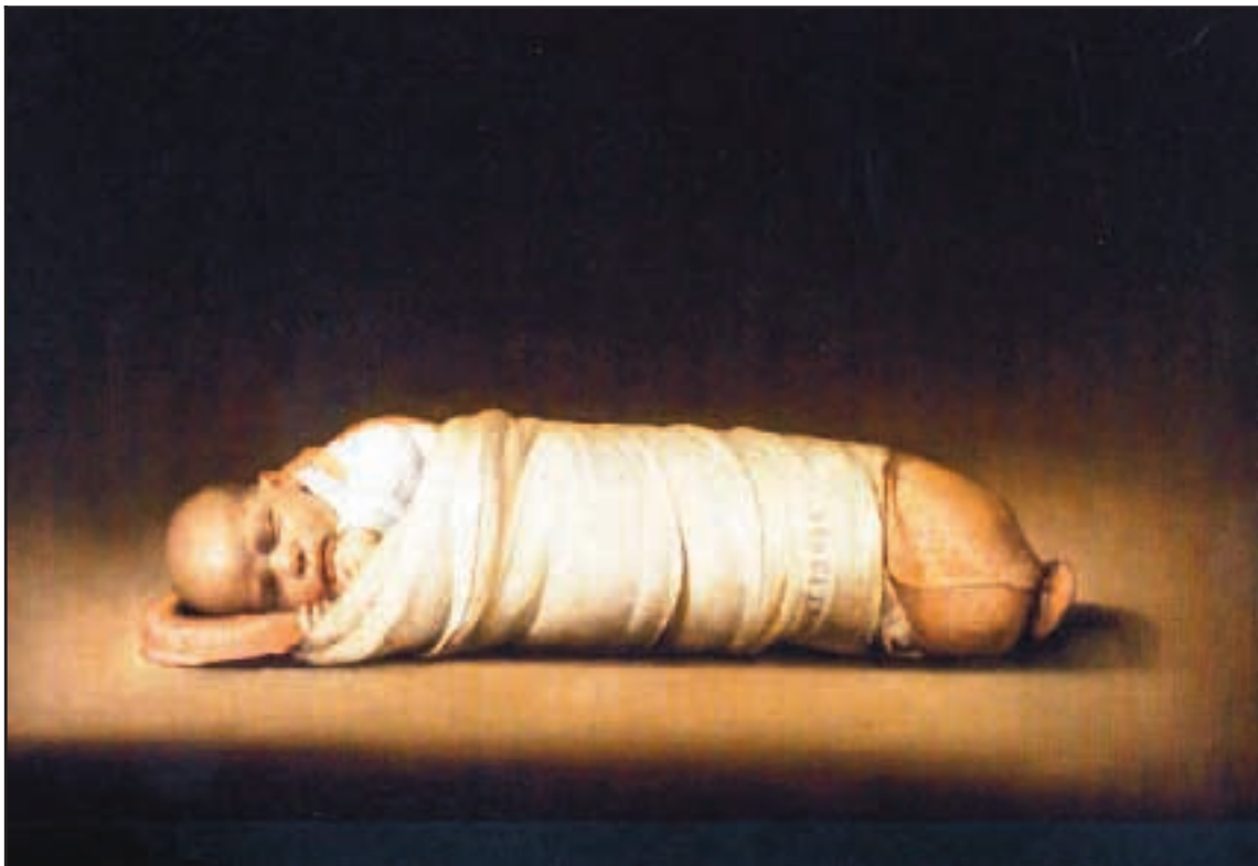
„Reifabarn“, frá 1982–1995. Olíulitir á striga, 58 x 85 cm.