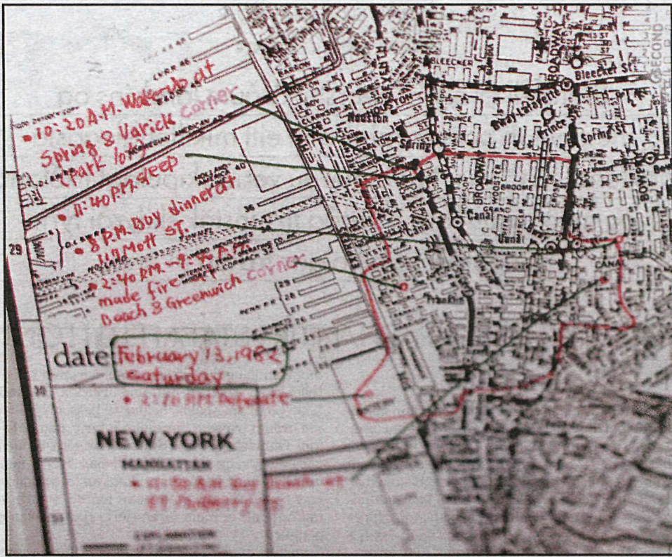
Teching Hsieh. New York-gjörningur 1983.