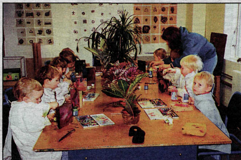
Það er rosalega gaman að teikna og mála Brautryðjendastarf í listkennslu 3-5 ára barna hefur verið unnið í Myndlistaskólanum í Reykjavík síðan 1999.

Samtök myndlistaskóla í Finnlandi (Förbundet för konstskolor för barn och unga i Finland) eru mjög öflug og njóta styrkja sveitarfélaga og finnska menntamálaráðuneytisins. Myndlistaskólar fyrir börn starfa í borgum og bæjum um allt Finnland og