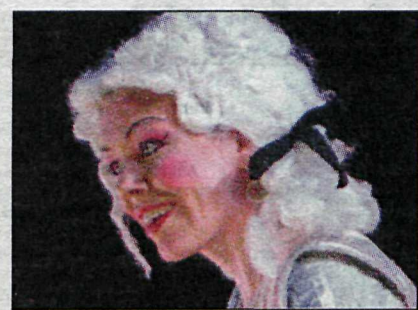
Drottningin í leikritinu í leikritinu.

Sýningunni „Úti er ekki inni, inni er ekki úti“ lýkur 27. október. Kjarvalsstaðir eru opnir alla daga kl. 10-17, miðvikudaga kl. 10-19.