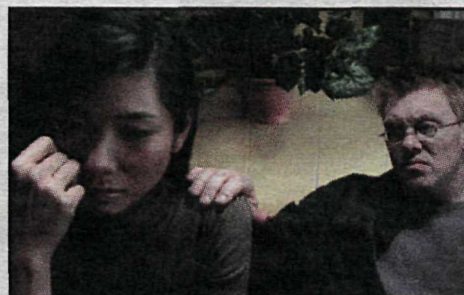
Maður eins og ég