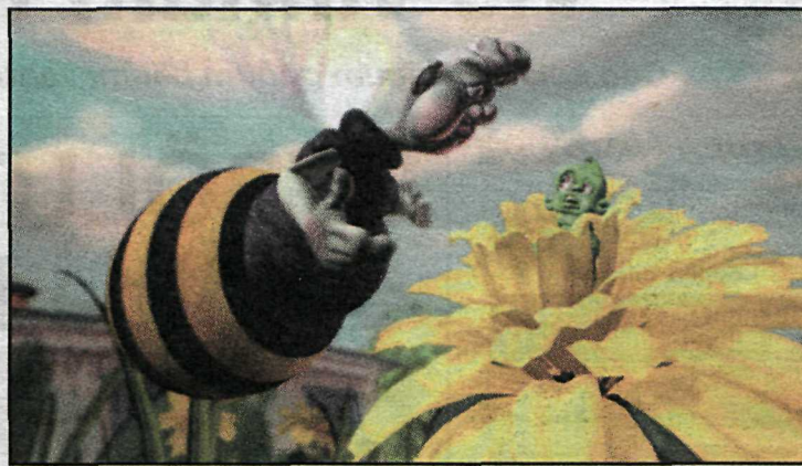
Litla lírfan ljóta

Sterk og áhrifamikil kvikmynd sem er hvort tveggja fjölskyldudrama og lýsing á lífinu í fiskiplássi.