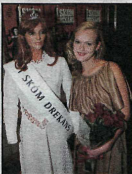
Í skóm drekans