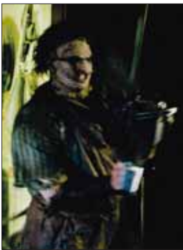
THE TEXAS CHAINSAW MASSACRE

mennum með sögna á lofti. Þeir sem vita að hverju þeir ganga ættu því að geta verið sáemilega sáttir við þessa útgáfu en þeir sem efast ættu að halda sig fjarri Leðurfési og hyskinu hans. ■