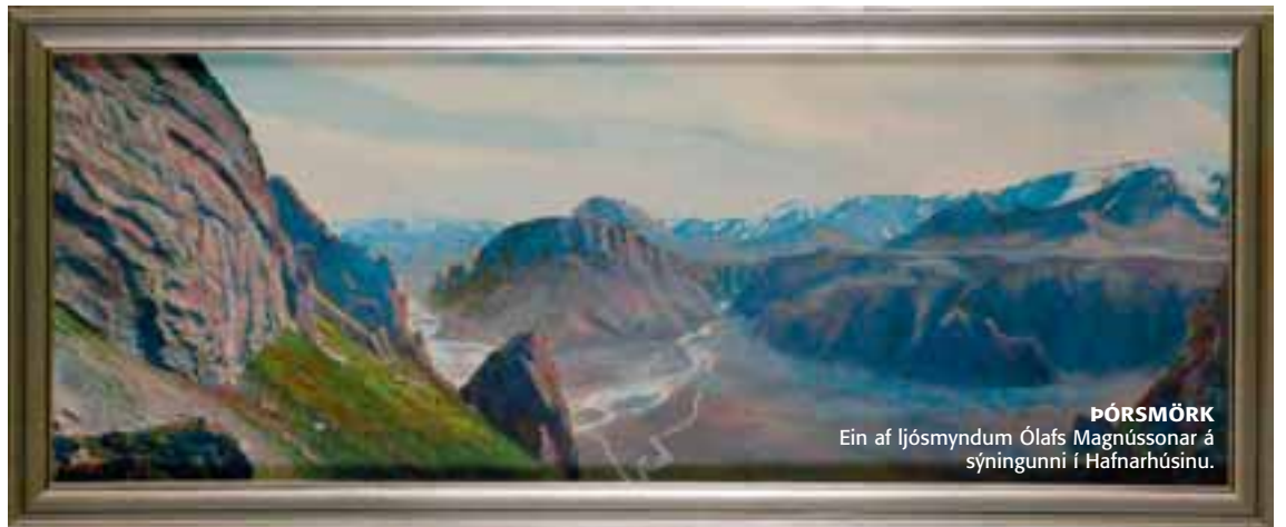
ÞÓRSMÖRK Ein af ljósmyndum Ólafs Magnússonar á sýningunni í Hafnarhúsinu.

Skíturinn og viðbjóðurinn í kringum úrkynjaða fjölskylduna, sem brytjar ferðalanga sem eiga erindi til Texas í spað, er alveg hreint ágætur og nokkur klassísk bregðuatríði hafa tilætluð áhrif. Ofbeldið sem gekk fram af fólki fyrir 30 árum er hins vegar ekkert til að tapa sér yfir í dag enda kippa sér fáir upp við aflímanir og húðflettingar á þessum tímum þar sem allt er leyfilegt. Vélsögin er að vísu orðin svolítið gamaldags og þunglamalegt morðvopn en það er samt eitthvað sjarmerandi við að sjá afmyndaðan óskapnaðinn hlaupta í æðiskasti á eftir ung-