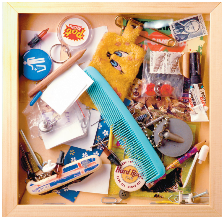
Þórdís Alda Sigurðardóttir: Sögulegt yfirfall.