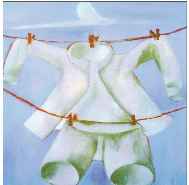
Spádómur Clementes unninn með olíulit á striga.

Clemente hefur starfað jöfnum höndum í Róm, New York og sveitum Indlands og tekið inn áhrif frá þessum ólíku stöðum. New York sem heimsborg auðs og efnishyggu, Róm sem stórbrotin menningarborg og höfuðstöðvar kaþólskunnar og Indland sem er samsafn af öllum andstæðum heimsins, ringulreið og reglu, „andardráttur guðs“ eins og indverski dulspækingurinn Sri Bagwan Rajsneesh kallaði það. Það er því ekki laust við að málverk Clementes séu rökrænum huga ráðgáta ef hann vill festa sig við einhver skýr mörk, meiningu eða væntir þess að fatta eitthvað í myndunum. Hér er skynræn upplifun í fyrirrími og myndirnar veruleiki í sjálfu sér. Það er þó margt í táknfræðinni sem vísar til austurlenskra fræða en annars virðast myndirnar samsettar úr ólíkum brotum, einhverju sem hefur snert