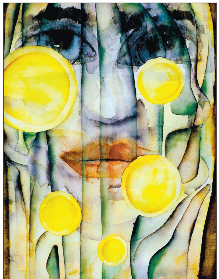
Vatnslitamyndir Francesco Clemente eru algerlega sér á báti.

listamanninn á lífsleiðinni, sem hann svo færir í myndræna frásögn, án upphafs og enda.