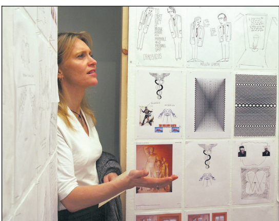
Þorgerður Katrín Gunnarsdóttir menntamálaráðherra virti fyrir sér verk útskriftarnemanna.