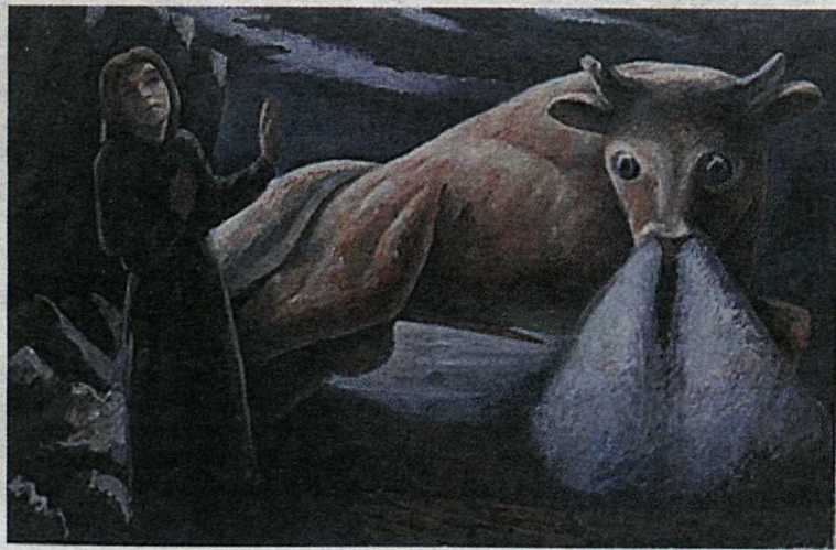
Porgeirsboli Verk eftir Jón Stefánsson frá árinu 1929.

fjalla um samband manns og náttúru, hvernig landslagið kveikir ímyndunarafl, höfðar til tilfinninganna og er myndlistarmönnum óþrjótandi uppspretta. Með vaxandi togaraútgærd í upphafi 20. aldar skapaðist grundvöllur fyrir starfandi listamenn sem gátu haft atvinnu af listsköpun sinni. Sú kynslóð íslenskra myndlistarmanna sem kom fram á sjónarsviðið frá aldamótunum fram til 1930 tók virkan þátt í sjálfstæðisbaráttu þjóðarinnar með því að dásama íslenska náttúru í verkum sínum á svipaðan hátt og þjóðskáldin.