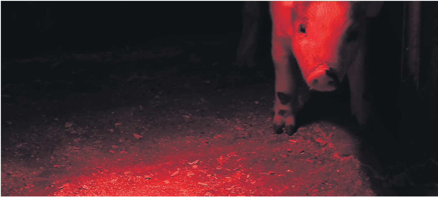
Í skápnem Kyrrmynd úr verki Sigurðar. Grísinn sem starfsmaður slátruhússins tekur sést hér lokaður inni í skápi.

» Hún fjallar um sið- blinda ballerínu og það sem hún gerir til þess að komast á toppinn... 39