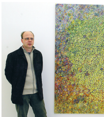
EGGERT PÉTURSSON Eitt hundrað verk eftir listmálarann seldust á fyrsta sýningardeg í Gallerí i8.

Ekki fékkst uppgefið hvert samanlagt söluverð var en samkvæmt heimildum Fréttablaðsins hleypur það á tugum milljóna.