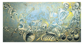
Dauðadansinn eftir Erró.

HÖNNUNARMÍÐSTÖÐ Íslands, verslunin Kraum og Listasafn Reykjavíkur standa fyrir nýstárlegri hönnunarsamkeppni sem felst í því að hanna nytjahlut með innblástri eða tilvísun í listaverk eftir Erró. Af því tilefni boða aðstandendur keppinnar til fundar í Hafnarhúsinu miðvikudaginn 21. janúar kl. 12.00 þar sem keppnin verður kynnt og gögnum dreift. Verðlaunahafi hlýtur verðlaun að verðmæti 500.000 kr. sem Kraum, Listasafn Reykjavíkur og Samtök iðnaðarins leggja til auk þess sem hluturinn verður seldur í Hafnarhúsinu og í verslunum Kraums.