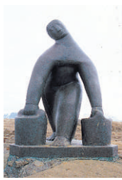
Vatnsberinn er þekkt kennileiti.

ÚTILISTAVERKIN í Reykjavík er nú hægt að skoða á netinu, á vefnum borgarvefsja.is. Þegar þangað er komið er smellið í valglugga efst í vinstra horni og hakað við orðið Listaverk. Þá koma merki á borgarkortið, og hvert þeirra táknar eitt listaverk. Ef smellið er á „i“ má nálgast upplýsingar um verkin, staðsetningu, höfundu þeirra og ártöl.