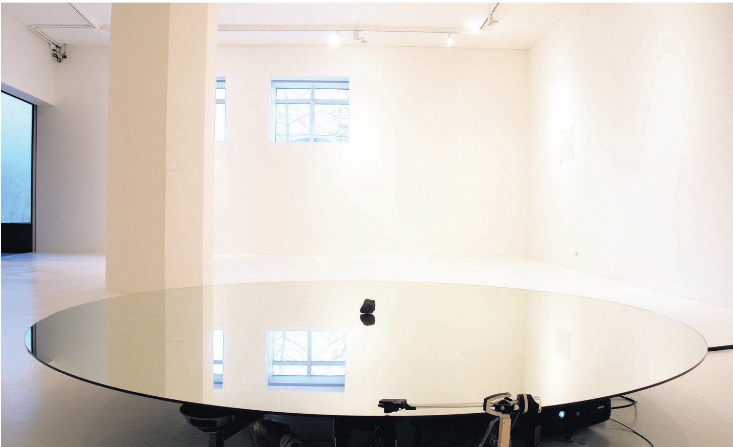
Plötuspilari „Umfangsmesta verk sýningarinnar er hringlaga spegill sem virkar eins og plötuspilar.“