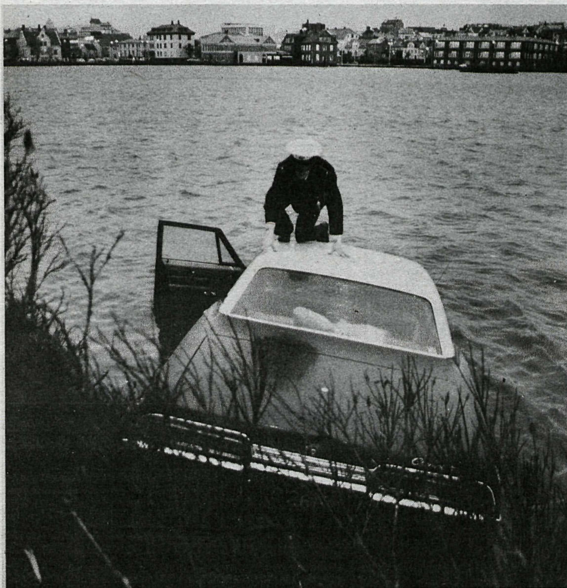
Lögreglumaður á leið úr bílnum.

STÖR amerískur bíll, sem í voru niður brekkuna við Ráðherrabústaðinn, þvert yfir Tjarnargötu og ofan í Tjörnina. Þar var bíllinn hálfur í kafi í vatni. Börnin eru