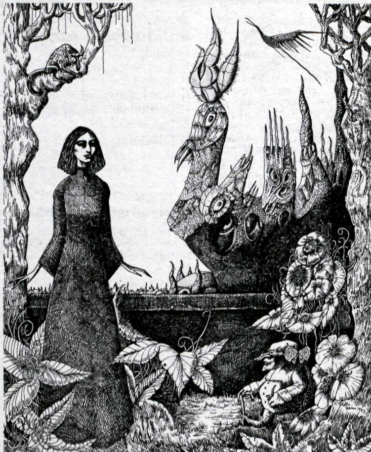
Alfreð Flóki: „Sendiboði prinsessunnar“, pennateikning 1973.

Í Kjarvalsall getur að líta hinn eiginlega þróunarferil listamannsins til hinnar sérstöku myndgerðar hans hin síðari ár er hófst árið 1965. Elztu myndirnar á sýningunni gerði hann tólf ára að