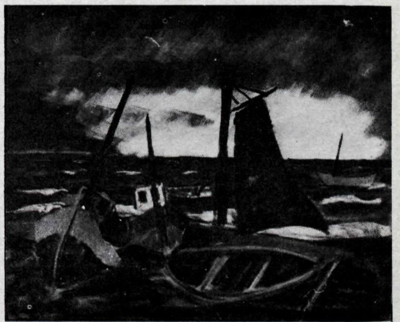
Bátar, himinn og haf.