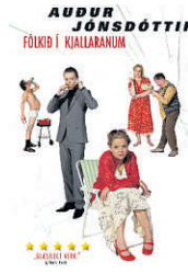
Kápa Fólksins í kjallaranum.