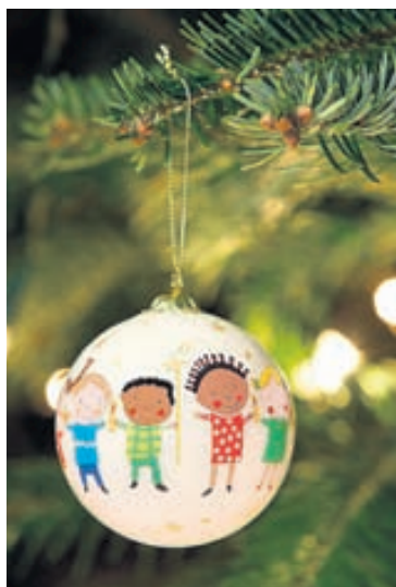
Árleg jólakúla UNICEF.

Að senda UNICEF-jóla-kort til vina og vandamanna er hefð á mörgum heimilum enda eiga kortin sér yfir hálfar aldar sögu á Íslandi. Jóla-kortin má nálgast í Bókabúð Máls og menningar, pósthúsum um land allt, í verslunum Pennans/Eymyndssonar, Bóksölu stúdenta og A4.