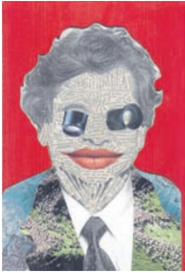
Frjálshygja eftir Brynjar Darra Baldursson.