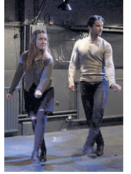
Úr sýningunni á Fjalla-Eyvindi.