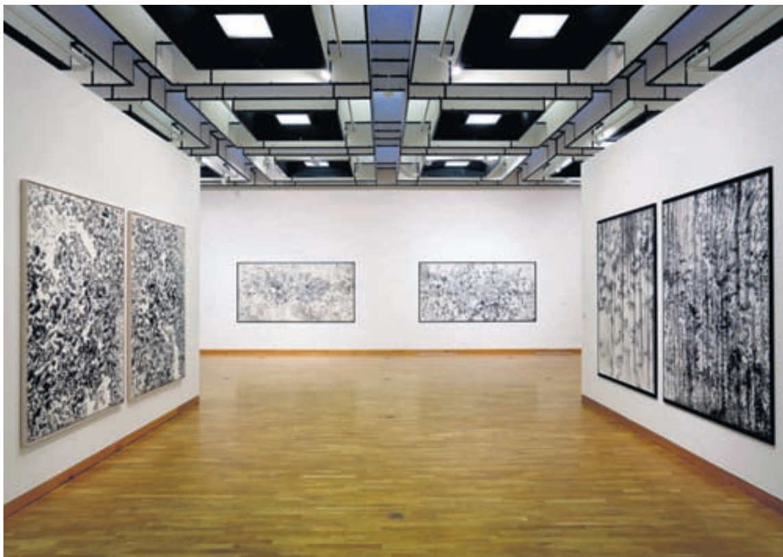
FINGRAFLAKKIÐ HUGLEIKIÐ Verk Ragnheiðar eru full af vangaveltum, heilabrotum, samfélags- og sjálfsskoðun, segir í dómi gagnrýnanda.

www.forlagid.is – alvöru bókaferlun á netinu