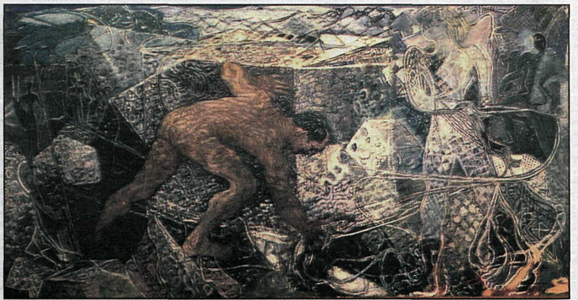
Krítik, olífa á léreft, 1946–1947. Í allri mannkynssögunni hefur vinnan og óvægin rýni á hlutina verið undirstaða mikilla afreksverka í list og mennt. „Fram til listarandans, ber þú óskir þínar, ef þú vinnur vel munt þú fá svar. Annars verður þú að leita að réttum spurningum.“ (Kjarval.)

Hér er tilefni að víkja að fleiri þáttum er varða Kjarvalsstaði, hins vegar nóg svigrúm til að gera einstökum verkum og hlutum skil sérstaklega, eftir því sem þörf krefur, því þessar þjóðargersemar skal vakta og beina kastljósi að, ræktar-semin aldrei ofnóg. Og þó er undarlegt að naumast skuli fitjað upp á neinu nýju á staðnum, að ekki sé kynnt undir öfugsnúna söguskoðun fyrir vanþekkingu eða eitthvað lakara. Þannig gat að lesa í Lesbók 29. janúar, að með þessari sýningu sé langþráður draumur að rætast um varanlegan samastað verka Kjarvals. Þarf ekki að fara nema þrjá áratugi aftur í tímann til rannsóknar á byggingarsögu Listaskálans á