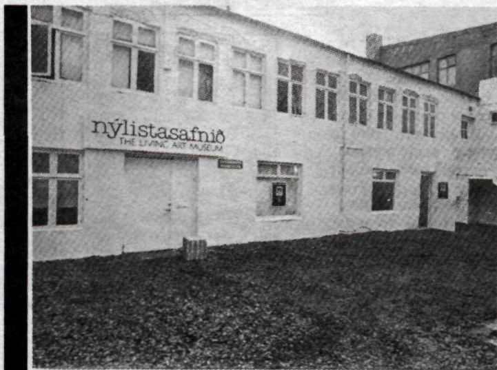
Nýlistasafnið við Vatnsstíg.