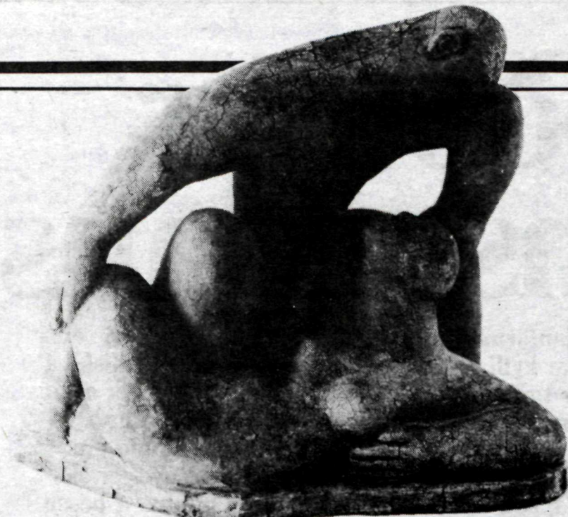
MADUR OG KONA 1943

hverfar og einlægar uppstillingar, þar sem blíðleikinn rímar við harmoníska heild verksins. Í þessum verkum er það umfram allt snertingin, sem miðlar ástinni og tjáir hana, ellegar þá samruni viðkomandi einstaklinga líkt og þeir verði hluti hvor af öðrum í ástinni. Í nokkrum verkanna má sjá karl og konu í klæðum en oftast eru þau nakin og þá ávallt mótuð af siðfærnislegri varfærni. Þannig eru kynfæri karlmannsins ávallt falin og kynfæri konunnar sjaldan sýnileg. Andspænis þessum verkum stendur áhorfandinn utan við myndefnið. Honum er aldrei boðið — huglægt séð — að taka þátt í „ástaratlotunum“ og samsama sig þeim einstaklingum, sem gefur að líta í verkinu, líkt og algengt er í evrópskri myndlist, sem hefur konuna og nekt hennar að myndefni.