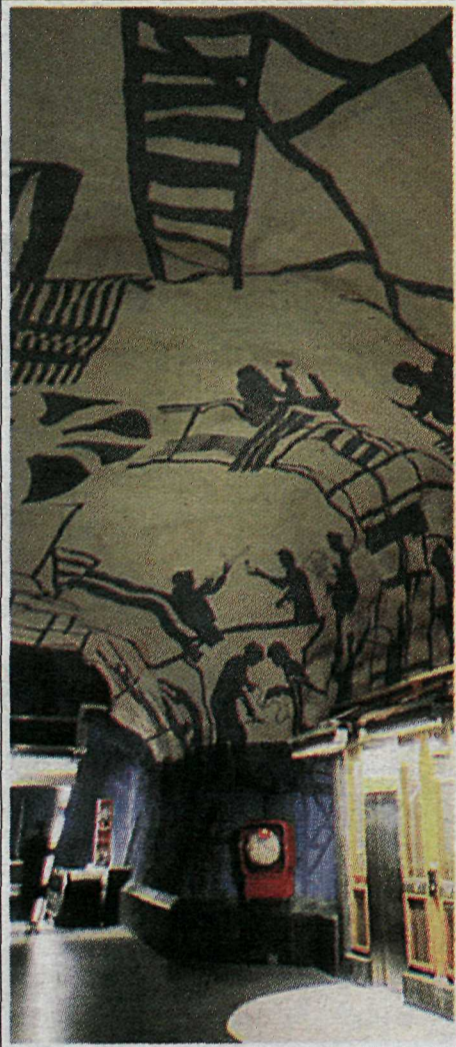
„HELLARISTUR“ á Aðaljárnbrautarstöðinni.