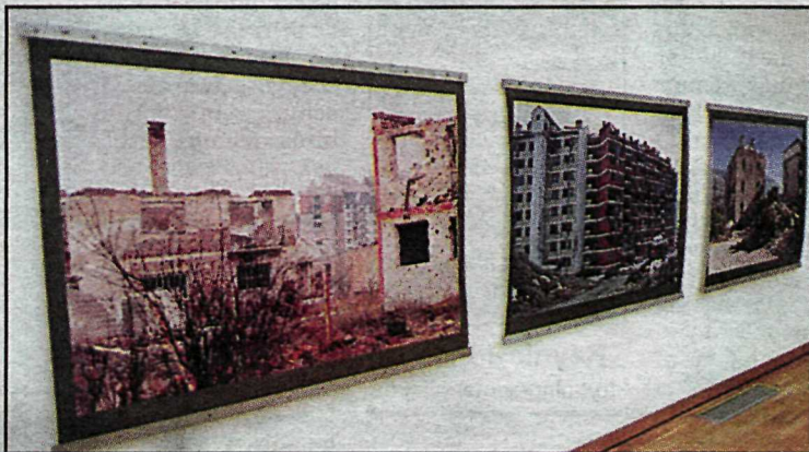
Frá sýningu Rúríar á Kjarvalsstöðum.

Í næsta rými er þremur myndböndum varpað risastórum uppá vegg. Myndirnar sýna daglegt líf í sundurskotnum og niðursprengdum borgum fyrrverandi Jógóslavíu