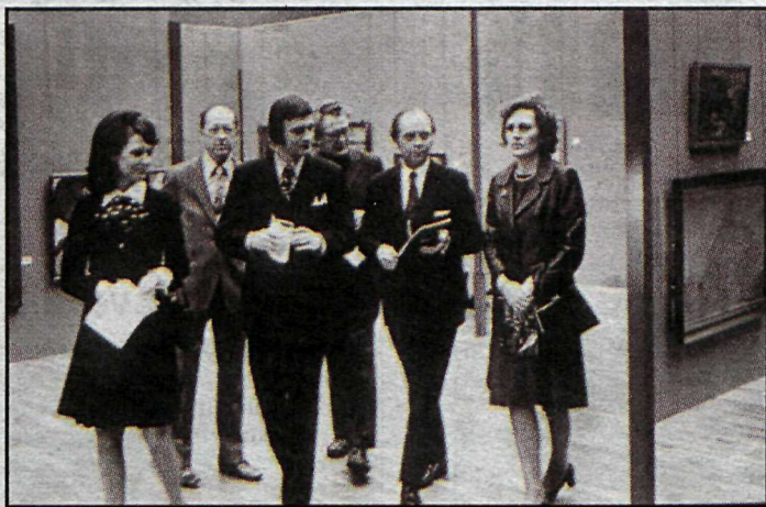
Frá formlegri opnun Kjarvalsstaða með Kristjáni Eldjárni forseta og frú Halldóru.