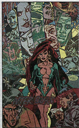
TIL VINSTRI: Aafter Burn, úr samnefndri myndaseríu. 162x97 cm, 1995. Erró ljóstraði því upp að þetta væri mynd sem hann héldi sjálfur mikið upp á. Til hægri: Le Nu Descendant l'Escalier, úr seríu frá 1989-1994. 83x100 cm.