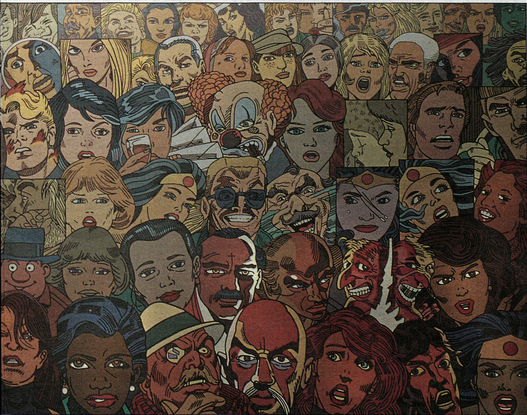
Inni Listasagan. 220x490 cm, 1992.

anna gerð skil. Það eru töggur í þessum skvímum þar sem þær standa ábúðarmiklar í forgrunni myndanna í fullri líkamsstærð. Margar þessara mynda verða á sýningunni í Hafnarhúsinu auk fleiri verka listamannsins frá síðustu árum. „Næst langar mig að gera konurnar enn stærri, eitthvað fjörukt og skemmtilegt,“ segir Erró. „Teiknimyndasögurnar hafa breyst svo mikið á síðustu árum að ég veit ekki hvað ég get notað þetta efni mikið lengur. Þær eru mikið til tölvu- unnar og undir japönskum áhrifum í útliti per- sónanna sem eru eins og lítill vélmenni með ská- sett augu. Þar er líkaminn að hverfa fyrir vél- inni.“ Teiknimyndpersónunum hefur Erró sankað að sér árum saman, hann segist safna persónu persónunum lengi og þegar sér þyki komið nóg þá byrji hann að vinna úr hráefninu.