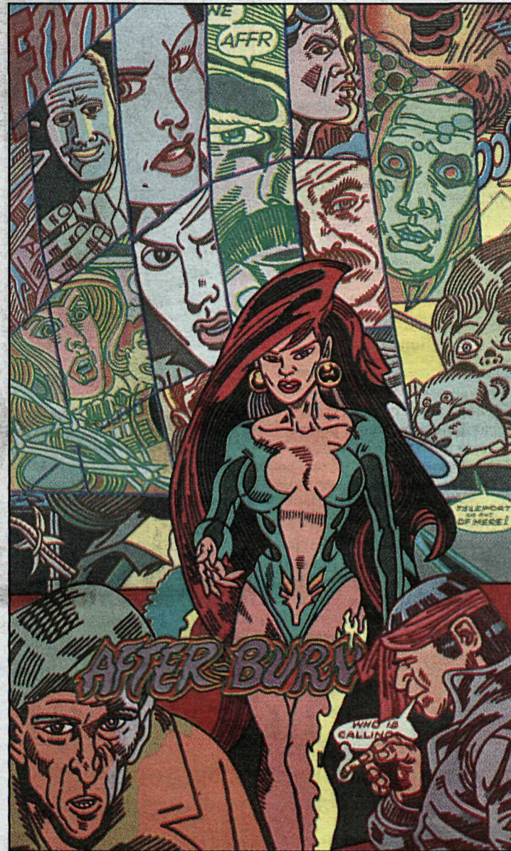
EIN af konumyndum Errós á sýningunni í Hafnarhúsinu.

Uppistaðan í sýningunni í Hafnarhúsinu eru konumyndir sem flestar eru byggðar á teiknimyndapersónum, en þarna er líka að finna myndir frá ýmsum skeiðum á ferli Errós svo í raun má segja að hér sé á ferðinni yfirlits-sýning. Ekki hefur verið gefin út stór sýningarskrá fyrir þessa sýningu, heldur einungis lítill bæklingur, en töluvert er nú til af útgefnu efni um myndir Errós á íslensku svo það kemur ekki verulega að sök. Þeir sem á annað borð þekkja til verka Errós þekkja líka stílinn á konumyndunum í Hafnarhúsinu. Hér byggir Erró á persónum og myndmáli teiknimyndasagna þar sem ofurhetjur og illmennir þjóta um í eilífri baráttu. Ímynd konunnar í þessum sögum er nokkuð fastmótuð. Líkamsbygging þeirra er sterkleg en ákaflega kvenleg um leið, þær eru kynþokkafullar en vægðarlausar valkyrjur. Erró dregur fram styrkleika þeirra með myndbyggingu þar sem áherslan er á hraða og baráttu og myndflöturinn iðar af lífi. Hins vegar er ekki auðvelt að segja hvaða gildi ímynd af þessu tagi hefur í hversdagslegum veruleikum ... hvort við getum í einhverjum skilningi sótt fyrirmyndir í þennan ímyndaða heim eða