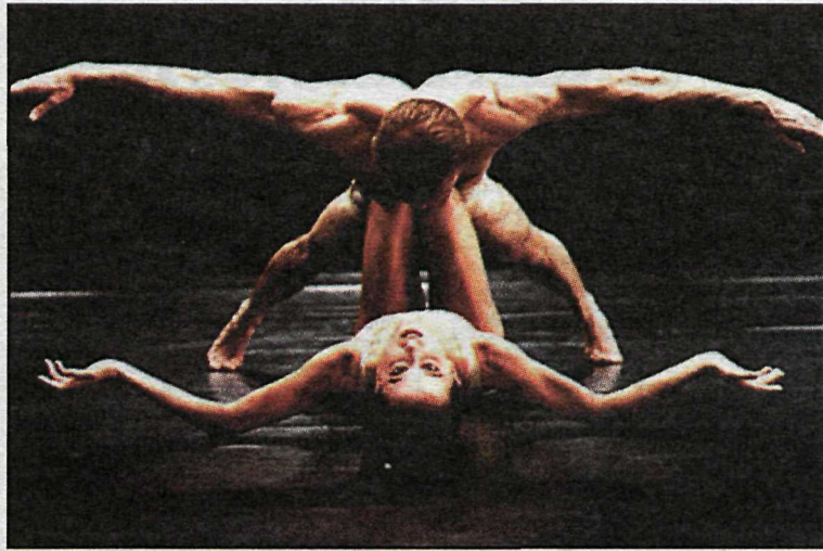
„Ballett sem er hugmyndaríkur, djarfur og alltaf frábær,“ segir í einum ritdómi.

Dansarar í NTD II eru á aldrinum 17 til 22 ára og tekst hópurinn á við krefjandi nútímaværk. Í NTD III eru hins vegar reyndar dansstjórnur sem komnar eru yfir fertugt. Þar nýta dansararnir reynslu sína til að