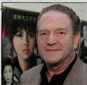
Erró fyrir framan eitt verka sinna.