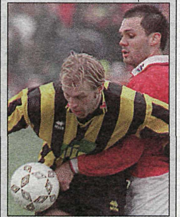
Valur og Próttur gerðu jafntefli í síðustu umferð í Úrvalsdeildinni. Liðin verða bæði í eldflunnunni í kvöld.