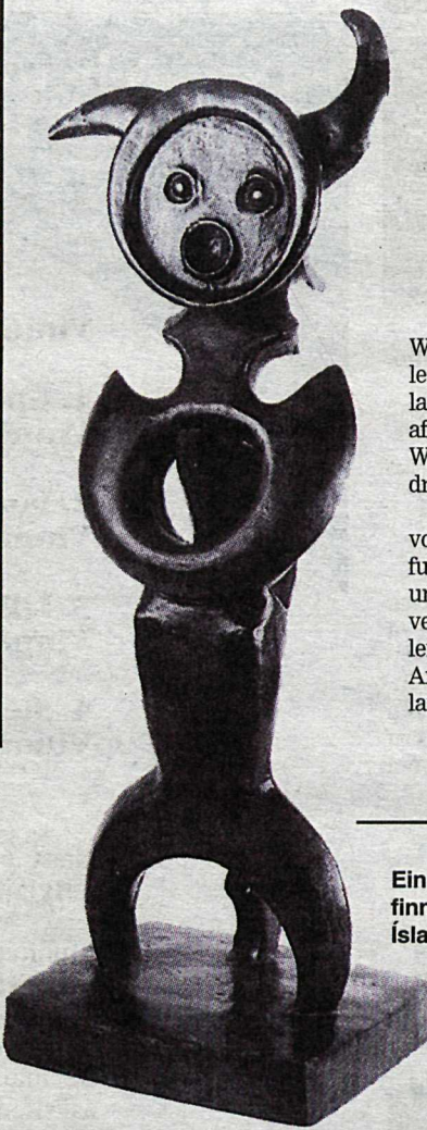
Ein höggmynda Max Ernst sem finna má á sýningu í Listasafni Íslands.

Sýningin verður opnuð á morgun og stendur til 7. júní.