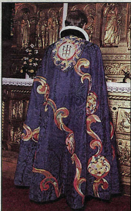
Kirkjuklæði hönnuð af Margréti II. Danadrottningu verða sýnd í Þjóðminjasafni Íslands.