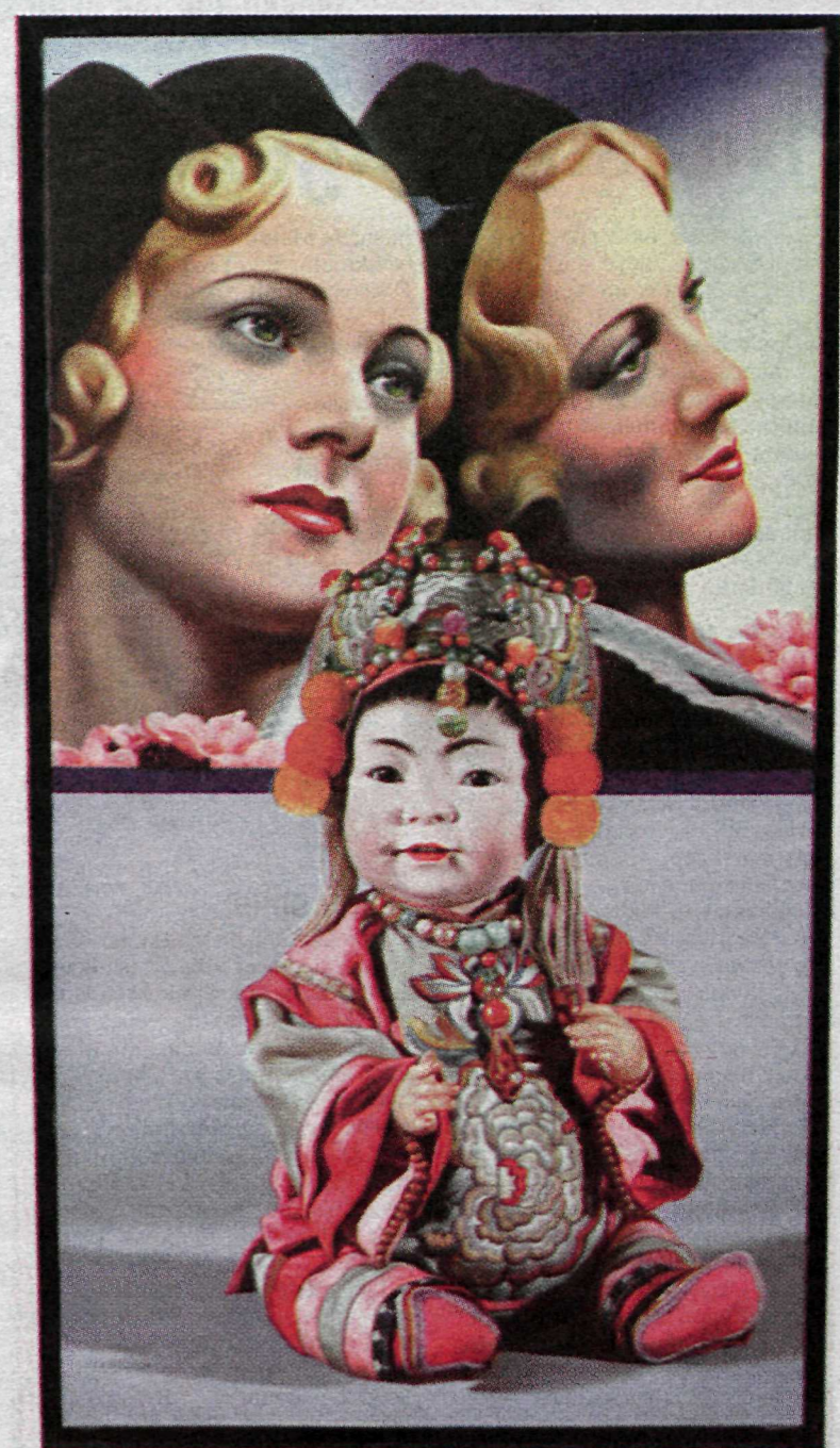
Ein af klippimyndum Errós.

En framleiðslan er ótrúleg. Í París einni borga þrjátíu þúsund manns í lífevrisjóð myndlistarmanna! Ég á góðan vin sem smíðar blindramma og hann smíðar meira en milljón slíka ramma á ári. Allir seljast og á þetta er málað en maður veit ekkert hvað verður um það síðan.“