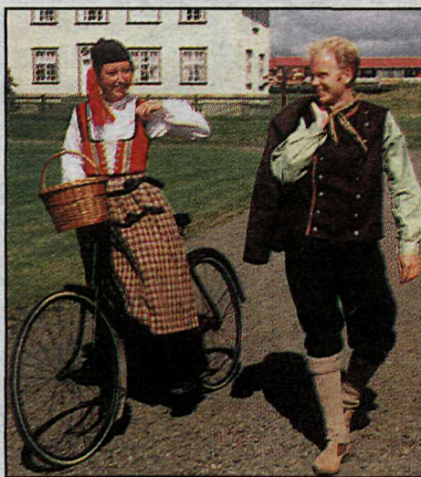
VIÐ torgið er yfirskrift sýningarinnar í Lækjargötu 4.

Veitingasalan í Dillonshúsi opnar um leið og safnið. Börn á öllum aldri geta nú skoðað nýju leikfangasýninguna „Fyrir var oft í koti kátt...“ í Kornhúsinu. Handverksfólk verður að störfum og alla sunnudaga verða sérstakir viðburðir.