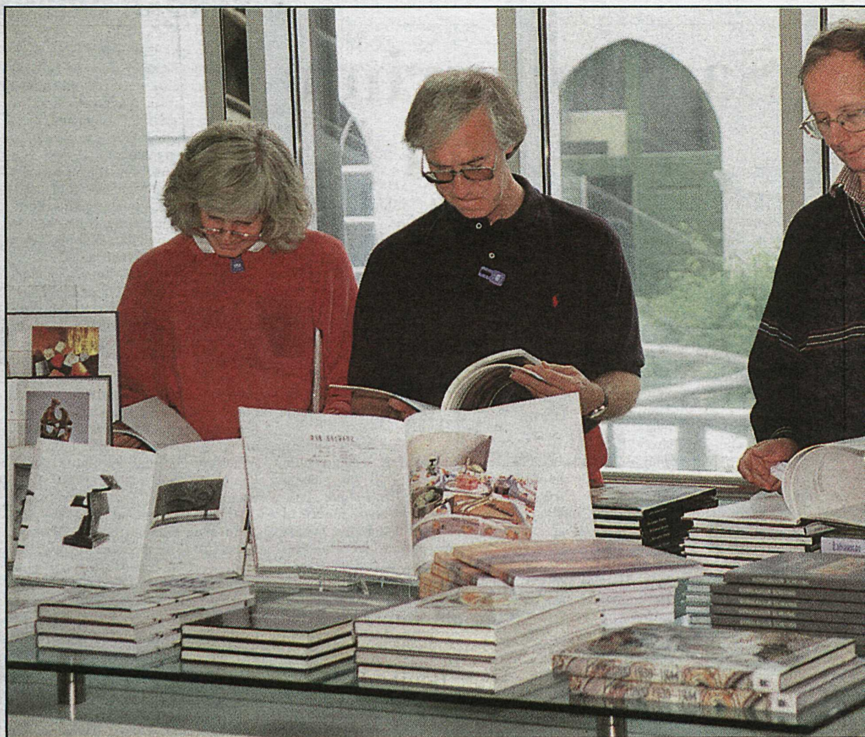
FERÐAMENN í heimsókn á Listasafni Íslands gaumgæfa bækur um íslenska myndlist.

Þótt Morgunblaðið gangi langt í birtingu aðsendra greina í nafni tjáningarfræslis er það vissulega ósk ritstjórnar blaðsins að greinahöfundar gæti meira hófs í orðum en þeir hafa gert um skeið.