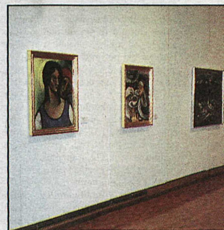
Í SAL abstrakt verka frá um 1950 til 1970. Menn m.a. verk eftir Finn Jónsson.