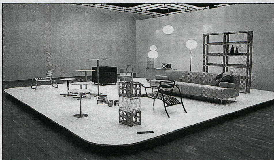
JASPER Morrison hóf feril sinn sem húsgagnahönnuður en húsgögn hans eru einföld, stílhrein og hafa mikið notagildi.