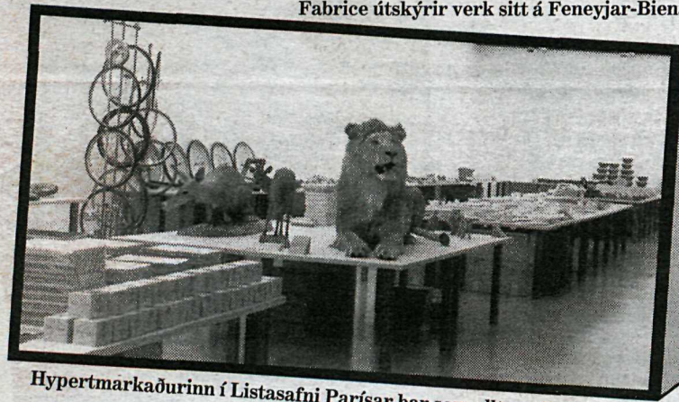
Hypertmarkaðurinn í Listasafni Parísar þar sem allt er til sölu.