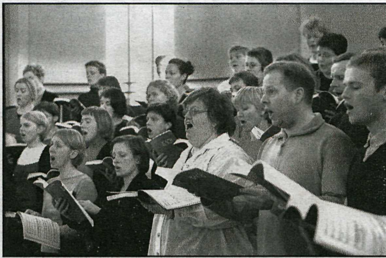
Mótettukór Hallgrímskirkju æfir Jóhannesarpassiuna.