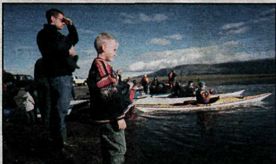
Horft út á sundin

Vinir og fjölskyldur sæfaranna mættu í fjöruna til að hvetja sína menn til dáða.