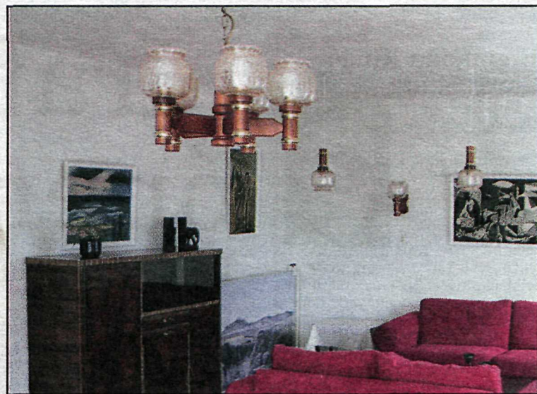
Til reiðu fyrir gesti

Vinir og fjölskyldur sæfaranna mættu í fjöruna til að hvetja sína menn til dáða.