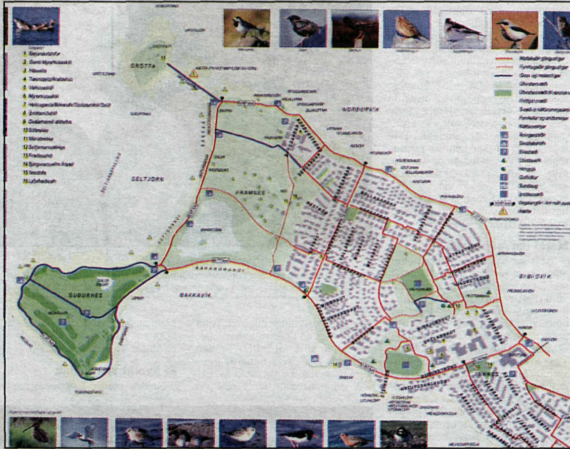
Gönguleiðakort sem umhverfisnefnd Seltjarnarness lét gera fyrr á þessu ári og dreifði í öll hús á svæðinu.