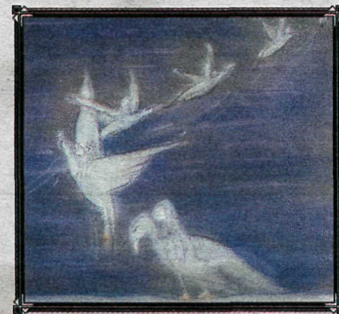
„Þau settust á bak vindfuglunum og flugu út í nóttina meðan við sváfum.“